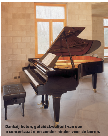
Arch. : Paul Driessens

Dankzij beton, geluidskwaliteit van een « concertzaal » en zonder hinder voor de burens.